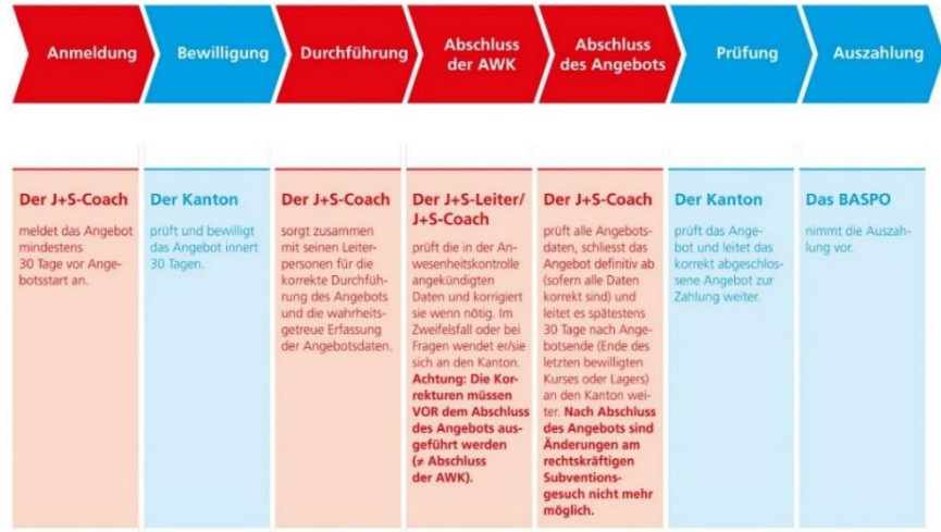
Abb. 1: Prozess J+S-Angebote

Die Bewilligung und die Prüfung von Angeboten der Kantone und der nationalen Sportverbände in der NG4 erfolgt durch das BASPO.